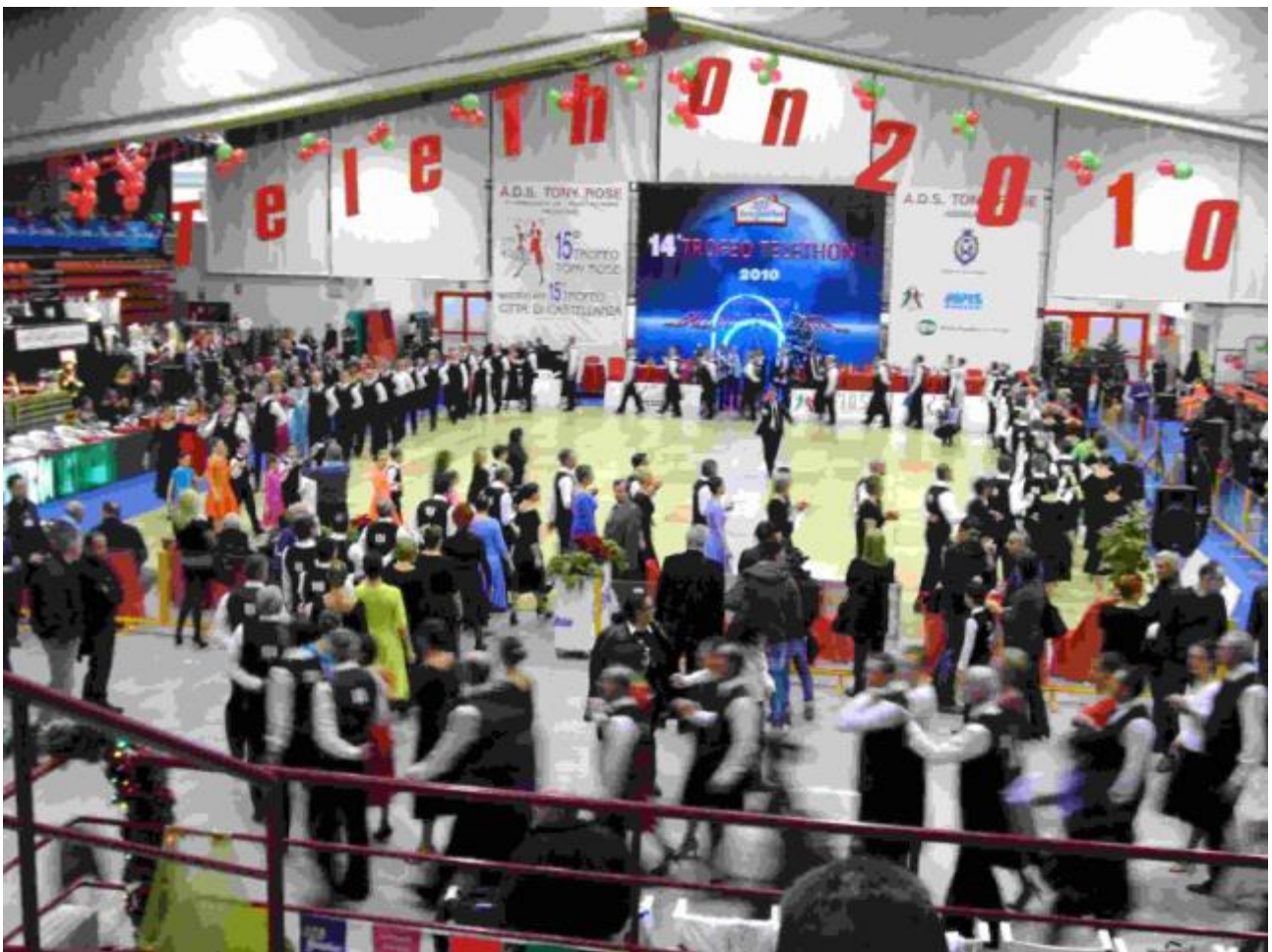
L'apertura delle competizioni che iniziano con la classe "C"

L'eccellenza della ricerca finanziata , la trasparenza e l'efficienza nella gestione dei fondi e il sostegno degli italiani sono i valori che ispirano Telethon nel lavoro di ogni giorno e che ne fanno una fondazione di ricerca biomedica riconosciuta a livello internazionale .