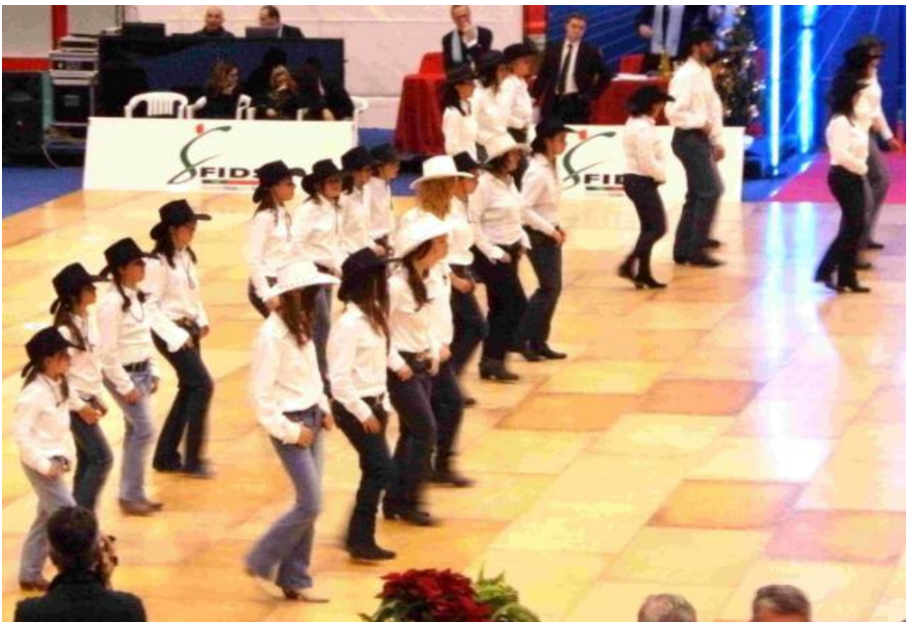
Un momento delle competizione Country

Dal 1990, grazie all'incontro tra Susanna Agnelli e l' Unione italiana lotta alla distrofia muscolare (Uildm) , la maratona sbarca anche in Italia, sulle reti Rai . Per diventare presto un appuntamento fisso, pronto a ripetersi e a superarsi ogni anno.